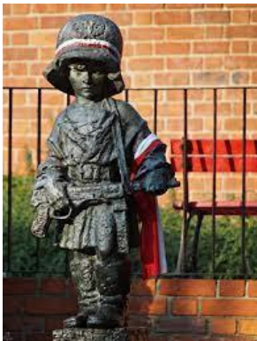
Pomnik Małego Powstańca Warszawa, Stare Miasto