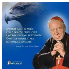
Bl. Ks. kardynał Stefan Wyszyński